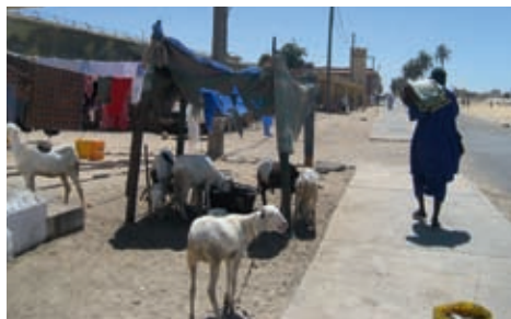
Cabres en un recinte familiar a Saint Louis, Senegal

Però són els més pobres i les dones qui queden en els marges de terres impròpies (aeroports, carreteres, parcs...) i allà desenvolupen la seva agricultura. Per les característiques que distingeixen el món rural del món urbà, podem definir les persones pobres.