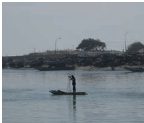
Pescador solitari a Saint Louis, Senegal

gran que accepten el vassallatge. Encara que funcionem sense diners se suposa que només hi ha una disciplina i una metodologia europea i que cap persona africana sortirà del guió, fins i tot, en termes intel·lectuals».