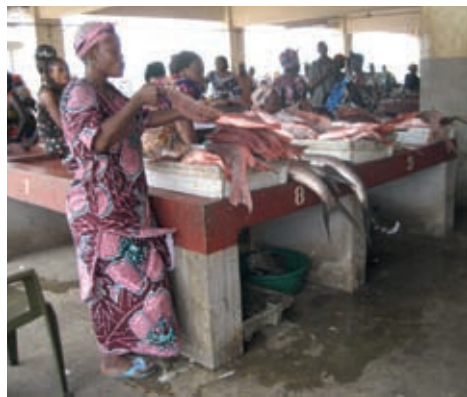
Venedores en el mercat de peix, Guinea Conakry

Va posar l'exemple d'un jugador de futbol del Betis el pare del qual es va morir i, en conseqüència, va haver de fer-se càrrec d'una cinquantena de persones de la seva família extensa africana... des de Sevilla. No va tornar a l'Àfrica, però va haver de controlar moltes situacions des de la península Ibèrica. Els termes comunitat i territori són molt amplis.