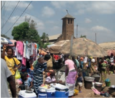
Venedores de fruita a Rufisque, Dakar

Les dones usen les activitats econòmiques populars per «canviar els rols de gènere i d'estatus» que els corresponen en la societat. Poden modificar la seva posició respecte als marits i la família.