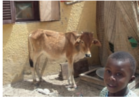
Animals i persones comparteixen espai, Saint Louis, Senegal.

Joaquim Chissano, fins aleshores ministre d'Assumptes Exteriors, assumeix la presidència del país i canvia el discurs antiimperialista del FRELIMO. S'obre llavors una nova via política i diplomàtica i s'inicien negociacions amb la RENAMO, dirigida per Afonso Dlakhama. El 1992 es conclouen els Acords de Roma, que obren pas a l'acceptació dels partits polítics i la democratització del país 20 i condueixen a les primeres eleccions democràtiques de 1994, en què guanya el FRELIMO de Chissano.