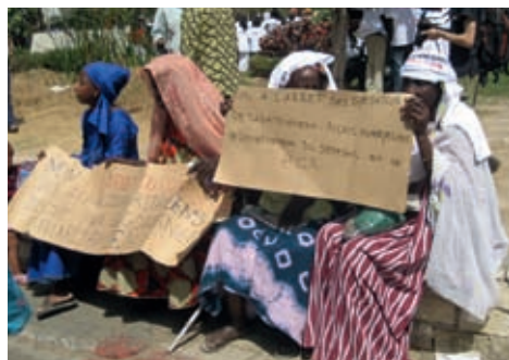
Refugiades mauritanes en contra de la repatriació durant l'FSM de Dakar, el 2011