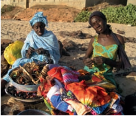
Dones venent a la platja, Dialaw, Senegal

getes telefòniques tenen? Tres com a mínim: d'aquí, d'allà i de la diàspora, segons assenyala un estudi de Papa Sow i Adela Ros (2007).