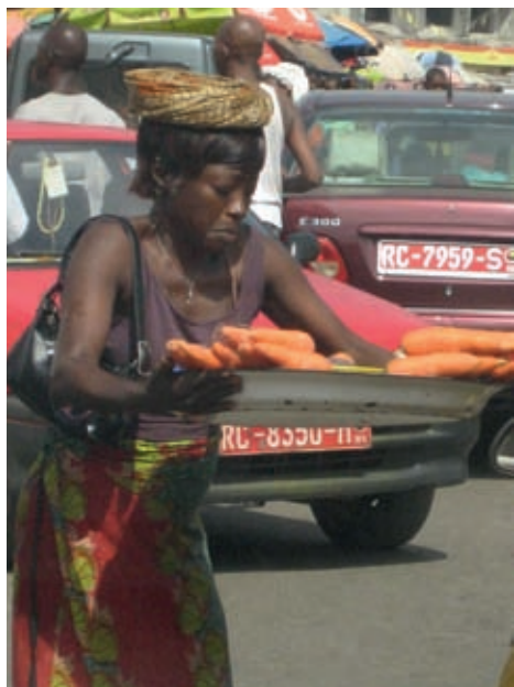
Venedora ambulante de pastanagues, Guinea Conakry

tant», va subratllar Crespo, «aquesta ciutat ja forma part de l'entramat multicultural africà, encara que només sigui als espais físics». Dos d'aquests joves ja no viuen a Barcelona, però tots van començar al casal de joves d'aquests barris.