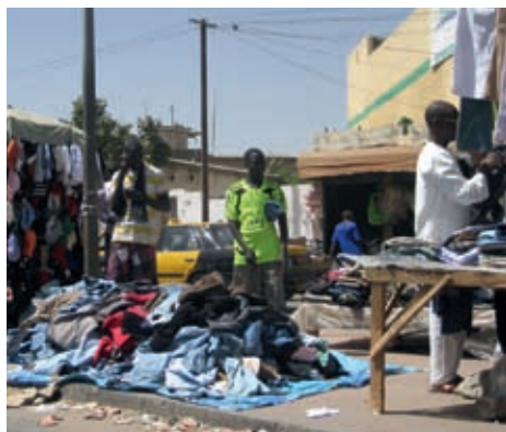
Mercat del boulevard Gueule Tapée, Dakar

La idea del neopatrimonialisme va sorgir al final de les dècades de 1950 i 1960. La majoria dels països va adoptar els patrons estatals de les antigues metròpolis, a l'estil anglòfon o francès, no hi fa res, però va ser un mimetisme considerable , començant per les elits que es volien modernitzar. Això no plantejava problemes ni discussions. Es van crear nacions noves, societats civils noves i empreses noves.