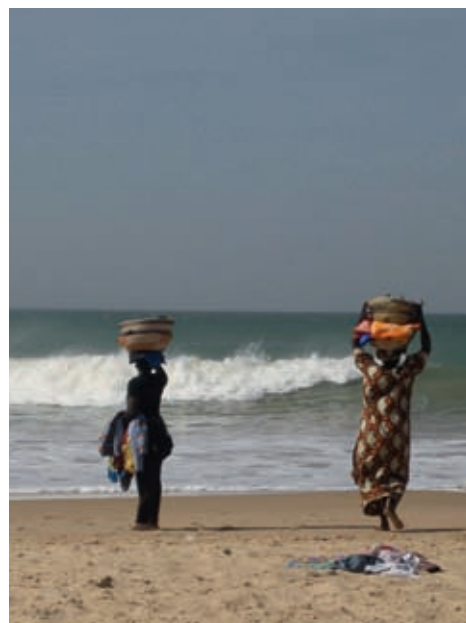
Venedores cercant turistes, Dialaw, Senegal

I s'ha traslladat a la migració, almenys entre les senegaleses i les equatoguineanes.