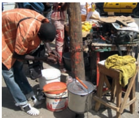
Venedor ambulant de cafè amb llet a Dakar