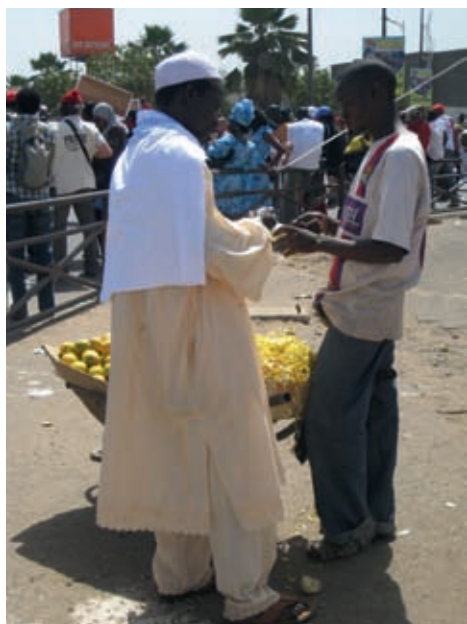
Venedor ambulant de taronges pelades a Dakar

da que ser liberal. Així ho va fer l'Etiòpia de Meles Zenawi o la Uganda de Yoveri Museveni i molts d'altres.