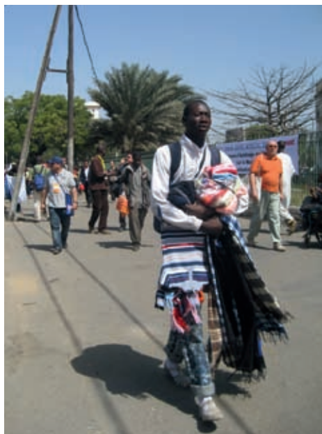
Venedor ambulat de roba a Dakar

El resultat de més de trenta anys de cooperació bilateral Nord-Sud ha demostrat que no funciona. La cooperació humanitària o al desenvolupament d'associacions privades o organitzacions no governamentals (ONG) occidentals «es veu més simpàtica», però tampoc no ha aconseguit resultats.