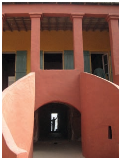
Pati central de la casa dels esclaus de l'illa de Gorée, Dakar

Mali era un dels territoris dels grans imperis de l'Àfrica occidental, ara molt reduït. I si parlem de fronteres artificials, Mali n'és una. Avui farem un «recorregut lineal en la seva història i les dificultats de l'Estat malià amb el nord del seu país», on sempre han tingut enfrontaments periòdics amb els tuaregs, des de la independència el 1960. Els tuaregs, la gent (blanca) del nord, i les persones de l'«àmbit sudanès» (negres del sud) s'oposen en molts aspectes