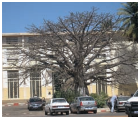
Universitat Cheik Anta Diop, Dakar. Baobab davant de les facultats

Tots els altres Estats africans actuals són nascuts de la colonització i les seves elits han estat formades i educades a les metròpolis occidentals de Londres i París. Encara que molts dels primers presidents africans de la Costa d'Ivori, el Benín, el Togo, Mali i Alt Volta (ara Burkina Faso) també es van formar a les universitats de Dakar i Saint Louis (el Senegal). També s'hi va formar el primer president del Senegal independent, Leopold Sedar Senghor, que era polític, poeta i professor de francès a París. Aquest president de l'ètnia minoritària serer —en un país on hi ha una majoria minoritària wòlof del 30-40 %— i de religió catòlica —on el 90 % de la població és musulmana— il·lustra la relació especial entre els conceptes ètnia , nació i Estat a l'Àfrica. I Senghor va governar al Senegal durant 20 anys, des de la independència el 1960 fins al 1980.