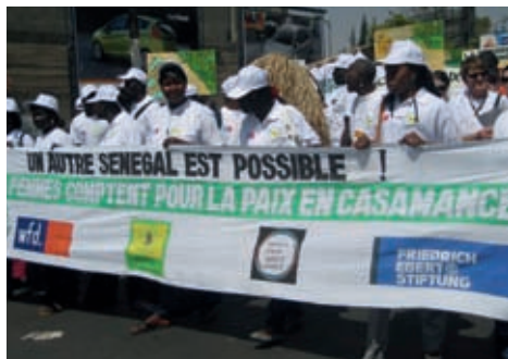
Manifestació de dones de diverses organitzacions per la pau (Casamance, Senegal)

ferents nivells, en els quals es comuniquen amb «altars» (el que anomenem fetitxes ). El rei és el màxim representant, però no és en un nivell superior, per sobre dels altres altars. L'altar del rei és un més; és com un consell restringit, però hi ha fins a 100 altars de la societat (per a delictes de sang,