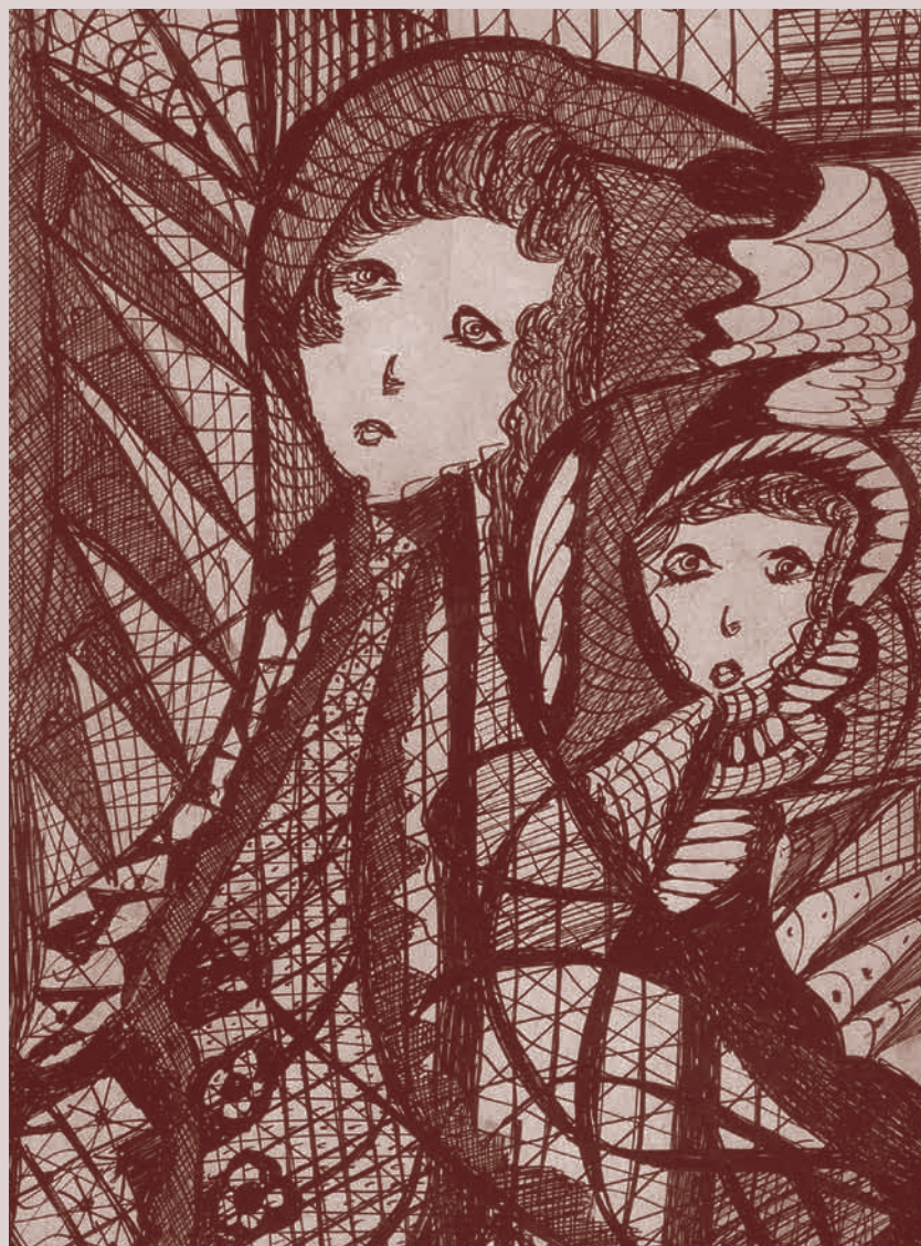
Madge Gill, "Sense títol". Tinta sobre paper, 44 x 26 cm

El proper 11 de gener s'inaugura el màster "Développement rural et coopération" a la Universitat Gaston Berger de la ciutat de Saint Louis, al Senegal. Aquest màster està organitzat per la